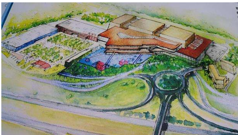
Boceto del futuro centro comercial de Espartinas, que creará 3.000 empleos - ABC

M. J. PEREIRA / - @mjesuspereiraSevilla - 05/04/2016 a las 12:01:12h. - Act. a las 12:12:14h.